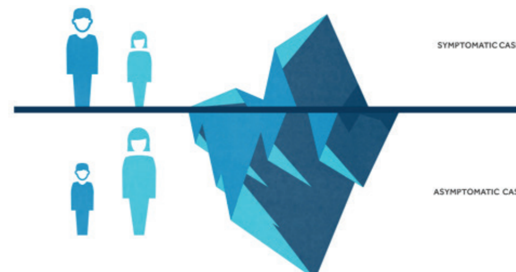
Slika 1. Odnos simptomatskih i asimptomatskih polno prenosivih infekcija

Stvaran broj oboljelih nije pouzdano poznat zbog velikog učešća asimptomatskih infekcija, poznato je da je kod žena u 80-90% slučajeva hlamidijaza asimptomatska, takođe u skoro 80% slučajeva gonoreja kod žena je asimptomatska. Odnos simptomatskih i asimptomatskih polno prenosivih infekcija prikazana je na slici 1., iz koje se može zaključiti da su asimptomatske infekcije češće kod žena, dok su simptomatske češće kod muškaraca.